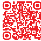
全通事務處理 全省徵求場所查詢

同協電子股份有限公司一一五年股東常會徵求場所地址【徵求股數限1,000股(含)以上】 徵求人：群益金鼎證券股份有限公司服務代理部(簡稱：群益金鼎服務代理部、群益金鼎) 台北市大安區敦化南路二段97號B2 電話：(02)2702-3999