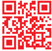
長龍會議顧問 全省徵求場所查詢